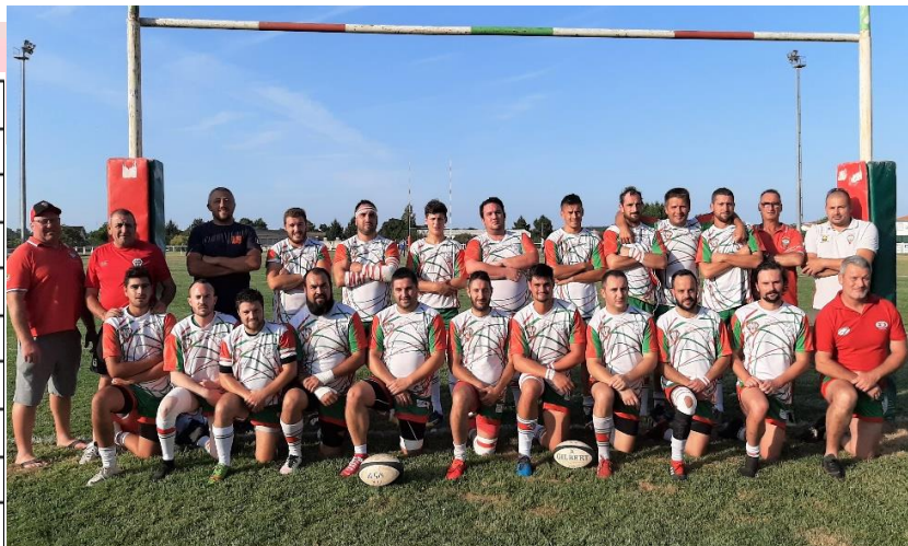
31 août 2019 (Challenge, contre Prignonieux : 42 à 12)